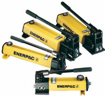
Von unten nach oben: P142, P392, P842, P802