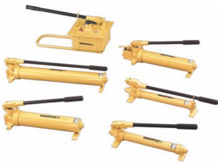
Von oben nach unten: