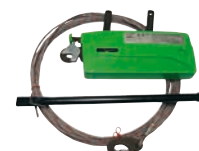
Grundausrüstung jockey® A5