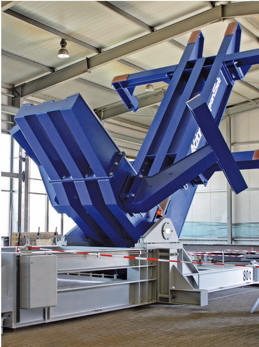
Bild: 80-t-Wendeeinheit für U-Boot Sektion